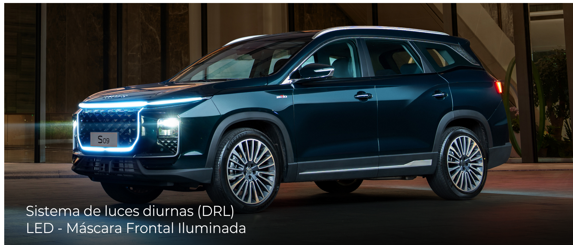
Sistema de luces diurnas (DRL) LED - Máscara Frontal Iluminada