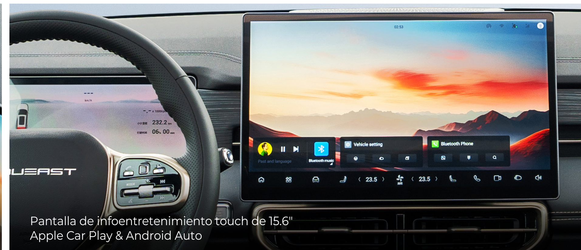
Pantalla de infoentretenimiento touch de 15.6" Apple Car Play & Android Auto