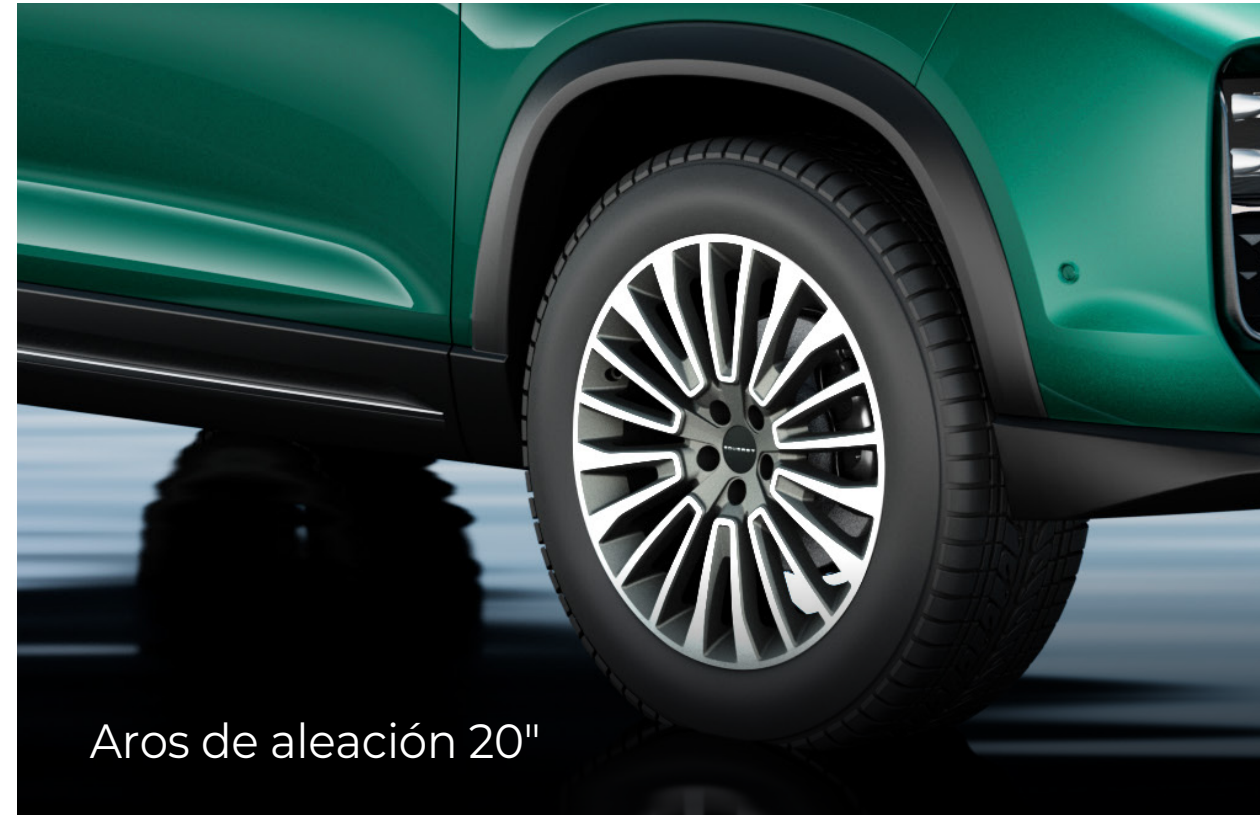
Aros de aleación 20"