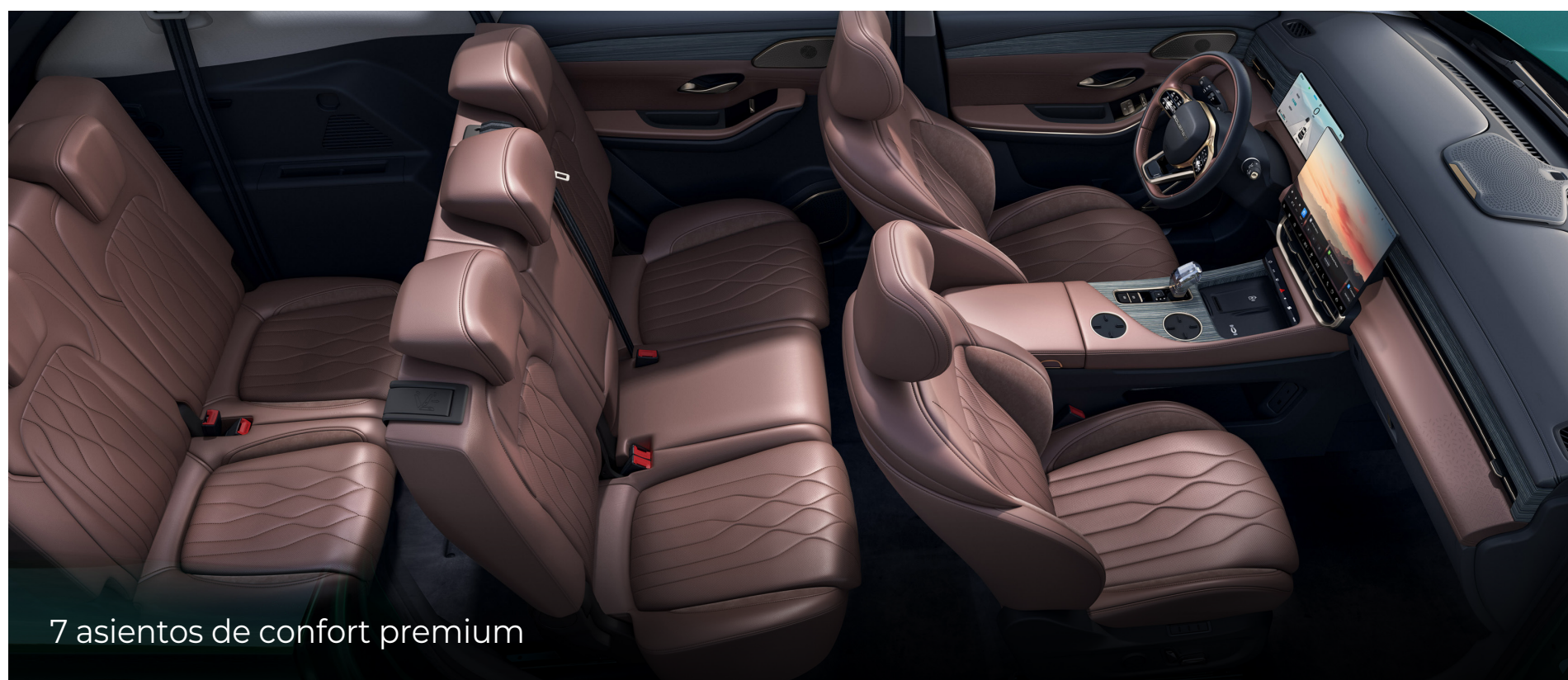
7 asientos de confort premium