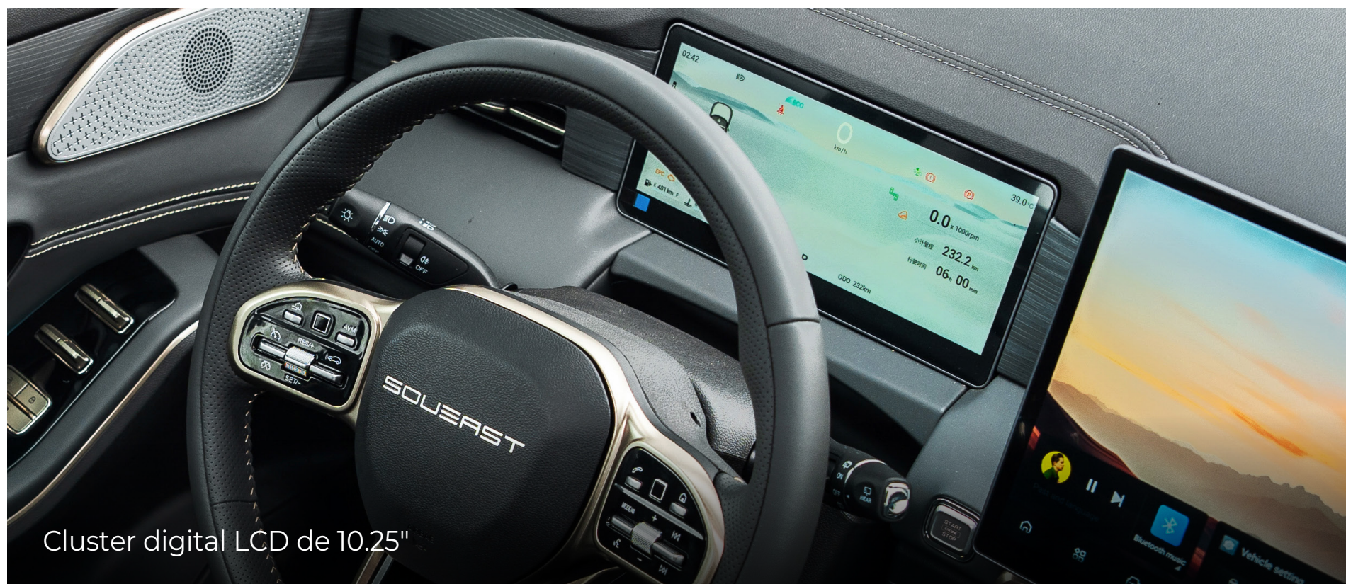
Cluster digital LCD de 10.25"