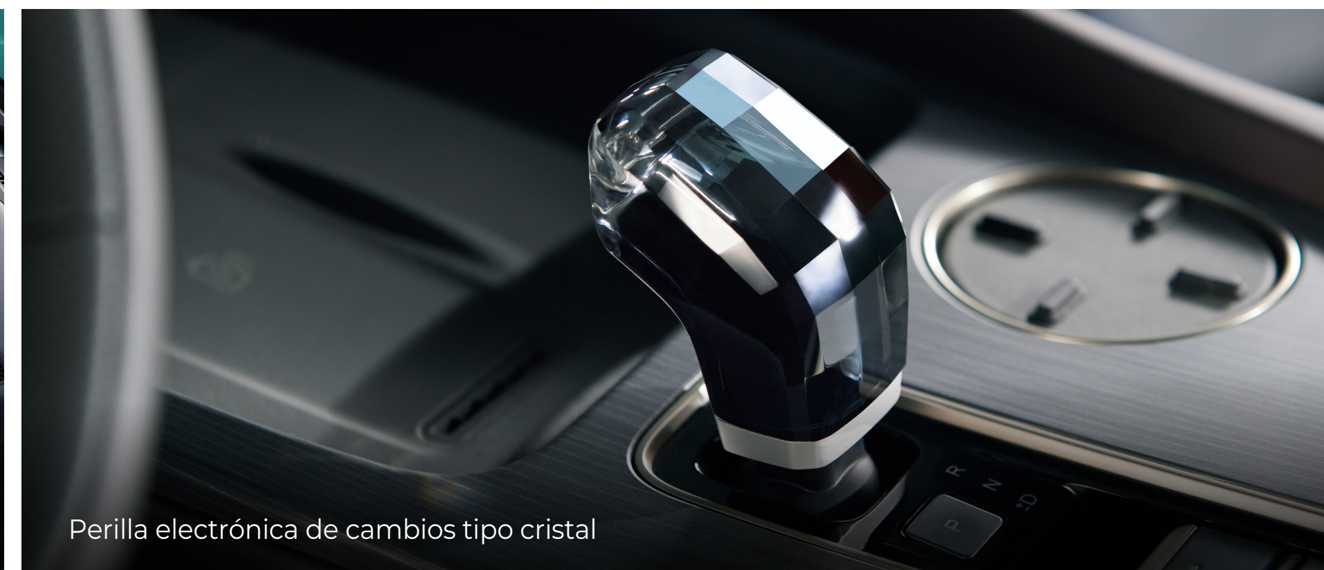
Perilla electrónica de cambios tipo cristal