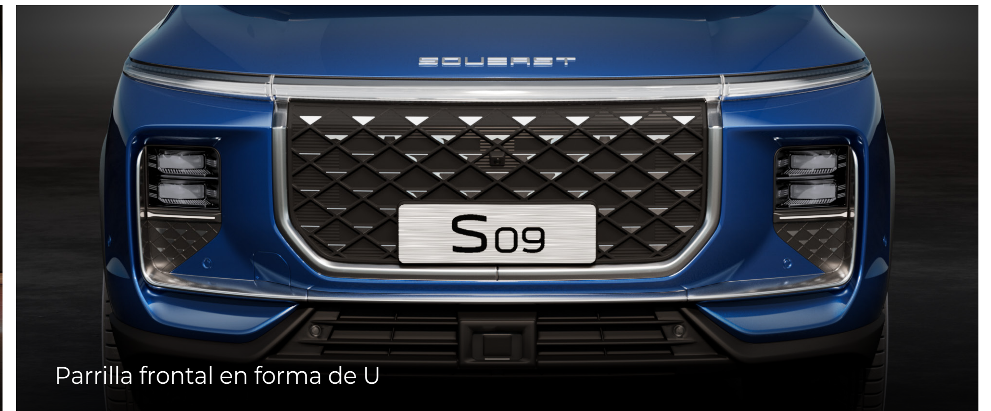
Parrilla frontal en forma de U