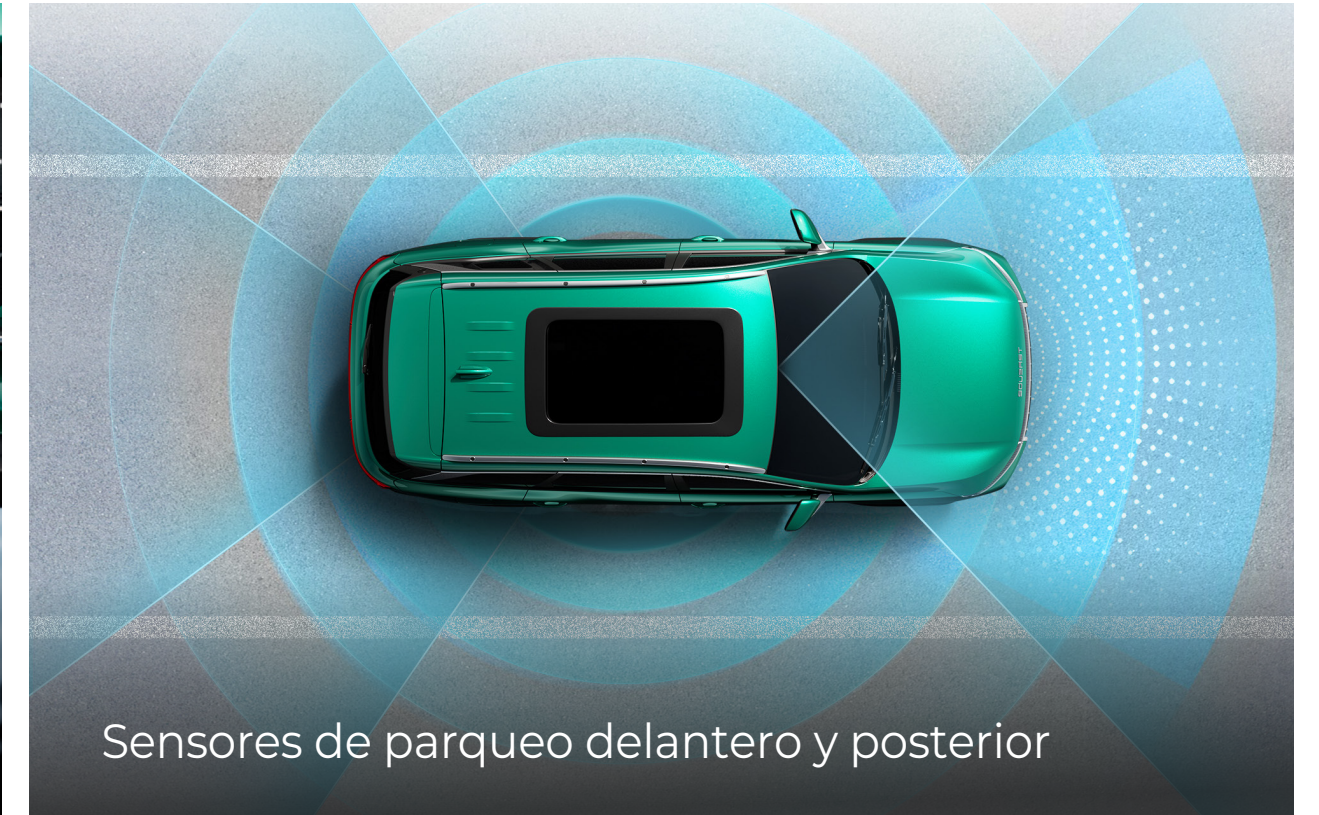
Sensores de parqueo delantero y posterior