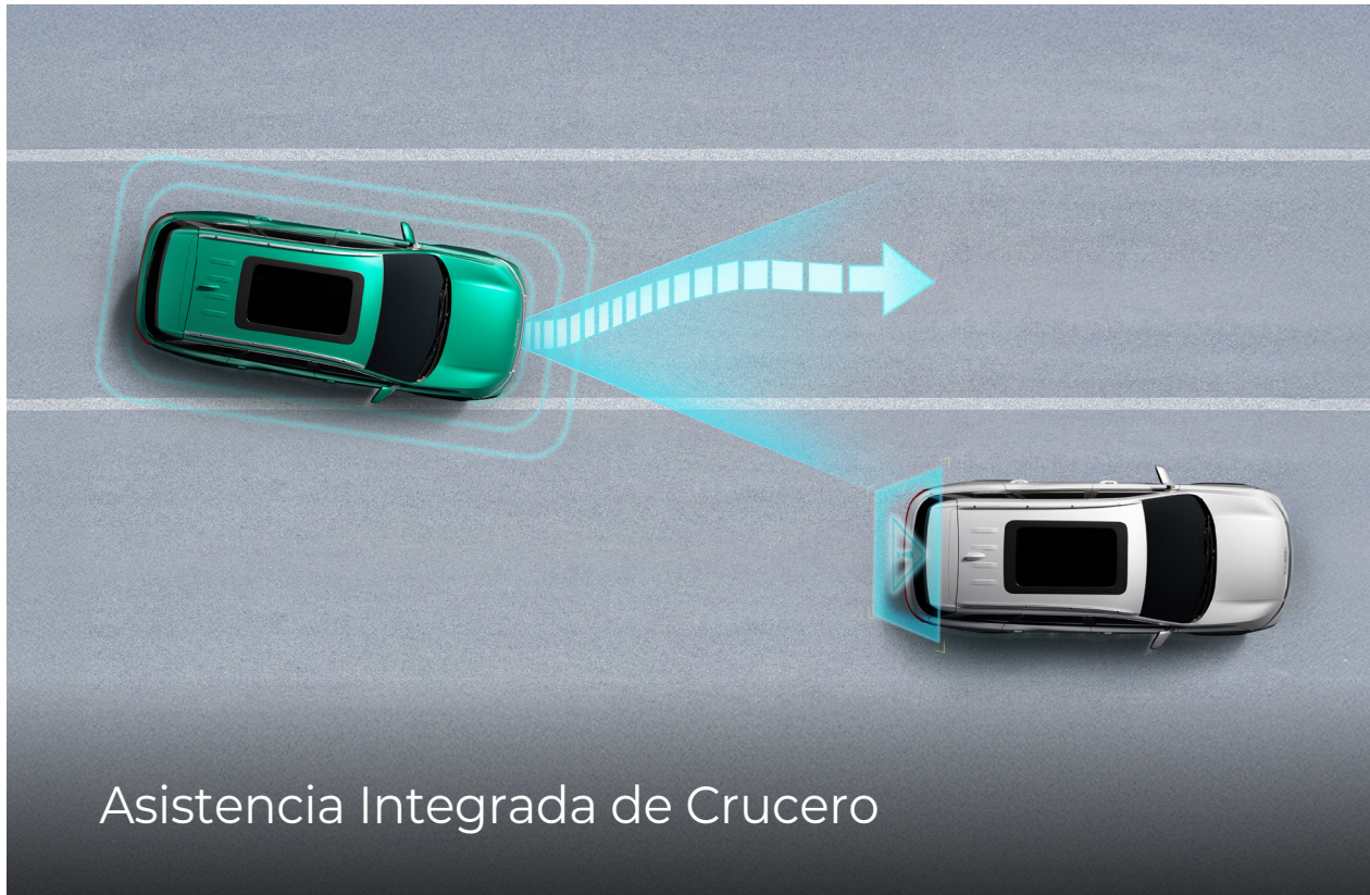
Asistencia Integrada de Crucero