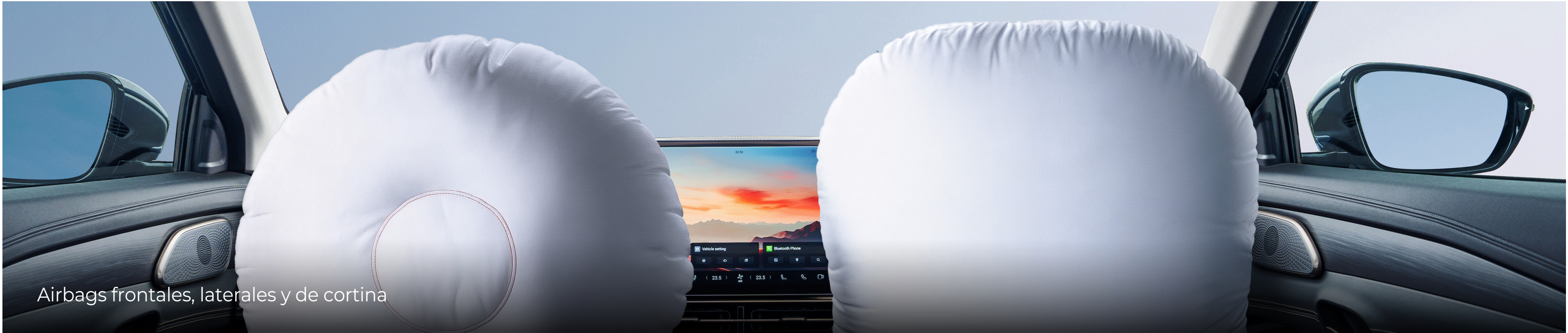
Airbags frontales, laterales y de cortina

Disfruta de tus viajes sin preocuparte por la seguridad, debido a las asistencias y atributos de la S09 diseñadas para salvaguardar a cada pasajero.