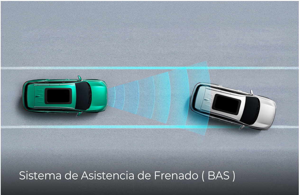
Sistema de Asistencia de Frenado ( BAS )