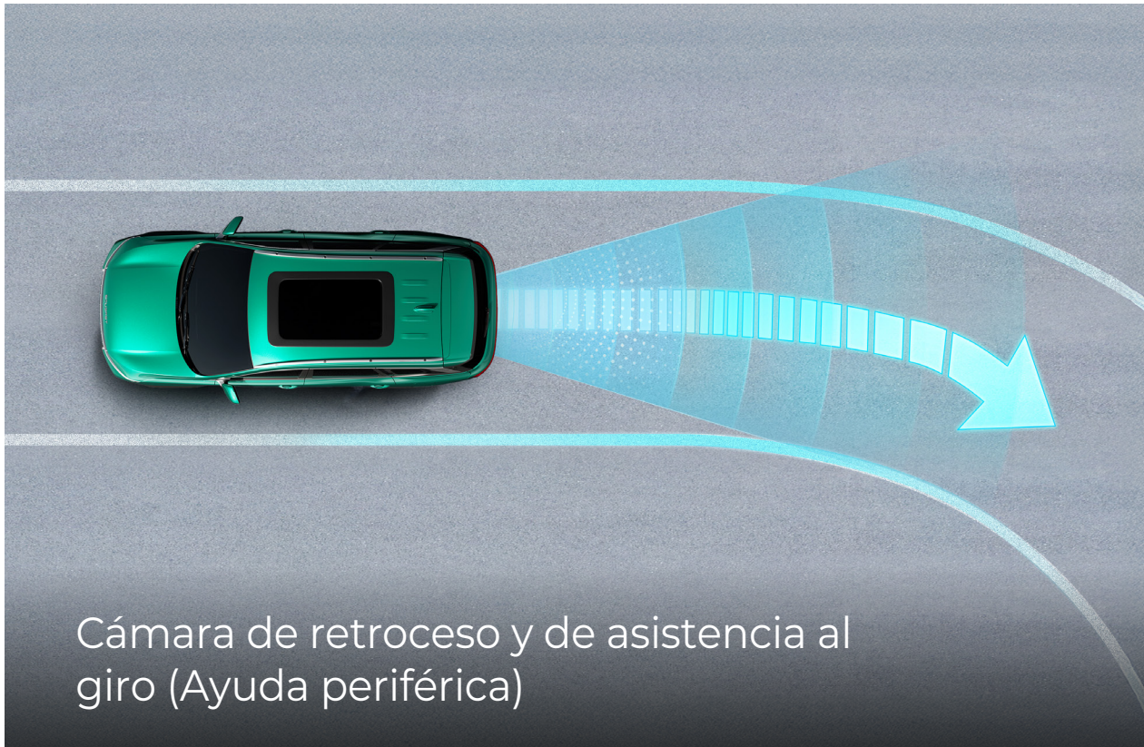
Cámara de retroceso y de asistencia al giro (Ayuda periférica)