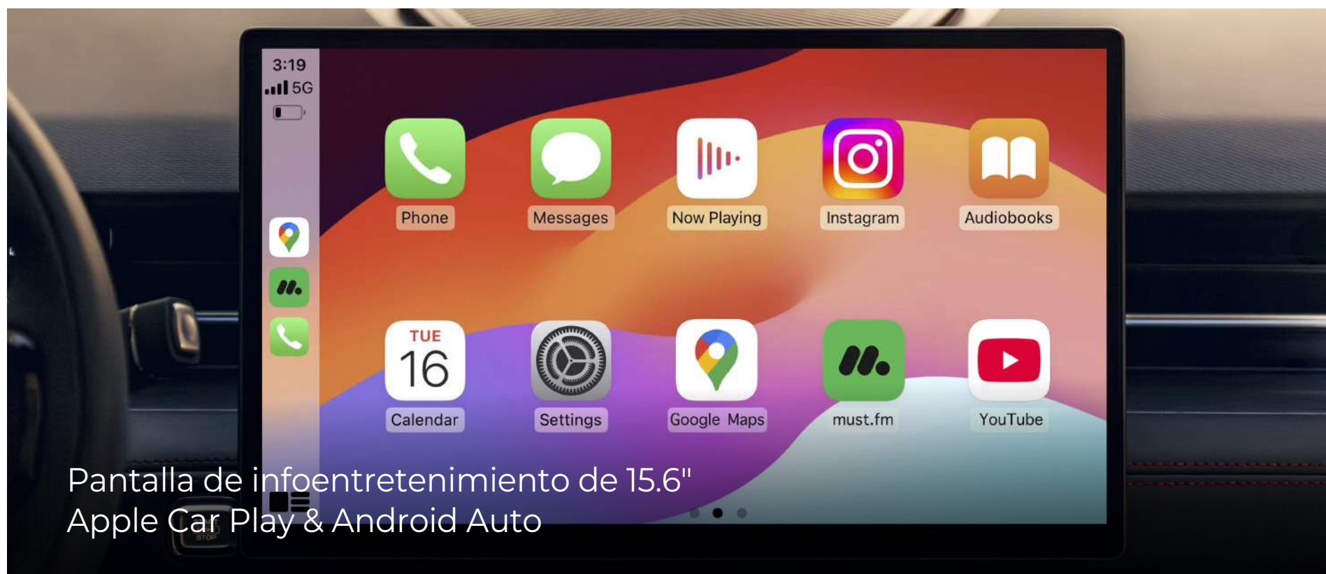
Pantalla de infoentretenimiento de 15.6" Apple Car Play & Android Auto