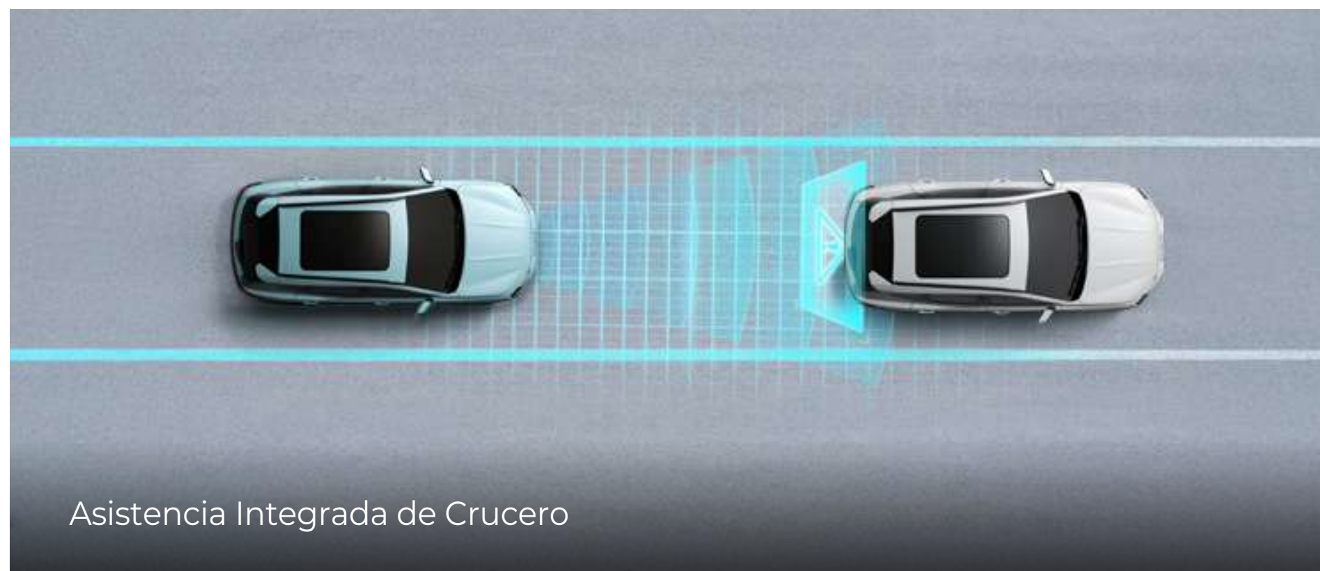
Asistencia Integrada de Crucero