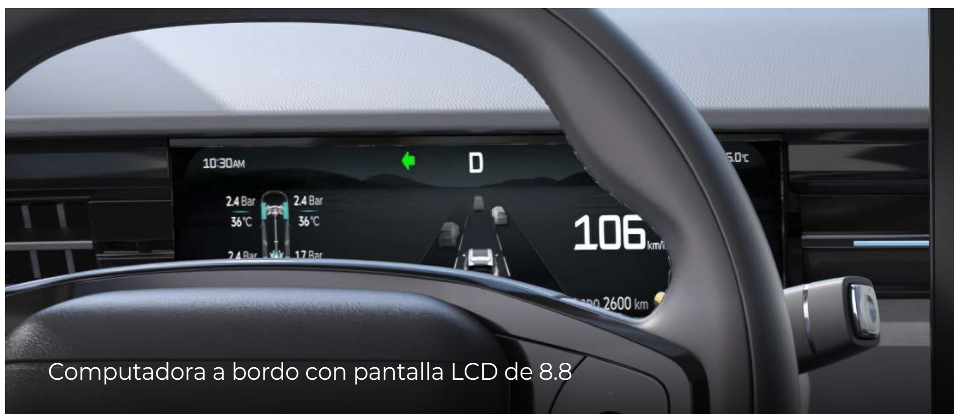
Computadora a bordo con pantalla LCD de 8.8