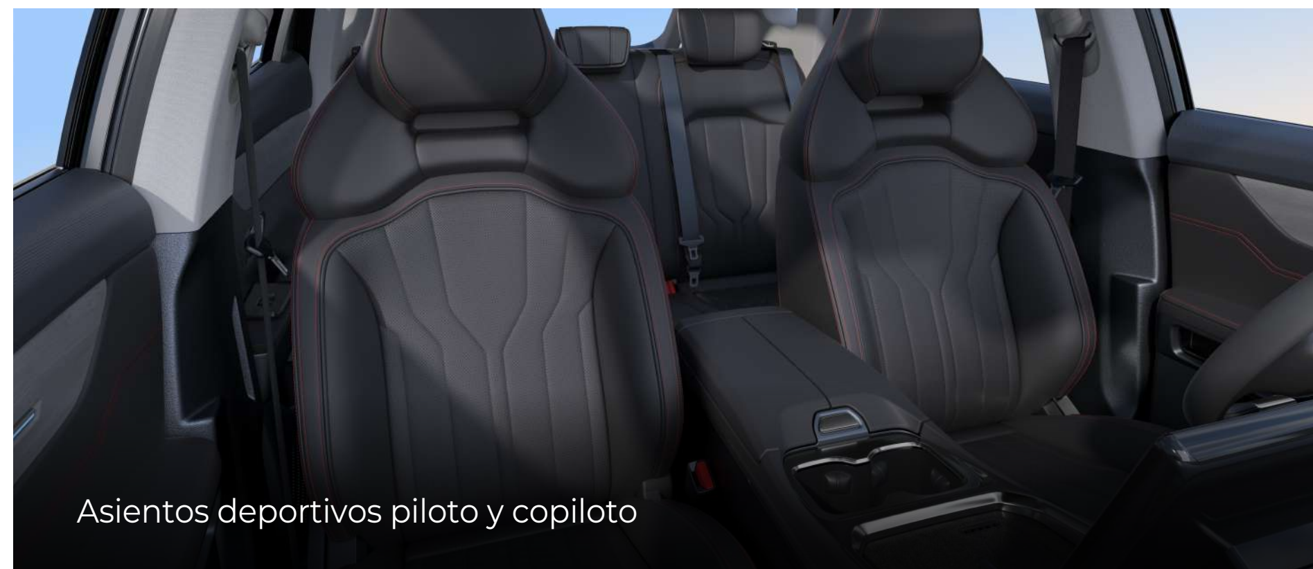
Asientos deportivos piloto y copiloto