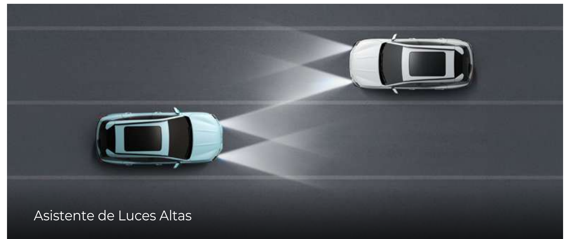
Asistente de Luces Altas